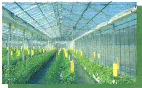
はる工房付近の畑地を借用し、第2春日園でトマトのハウス栽培を開始（平成23年9月）

「のぞみ」では、法人の各事業所が開設されるまでの経緯と現状を簡単に振り返ることにより、法人の現状を「紹介したい」と思います。