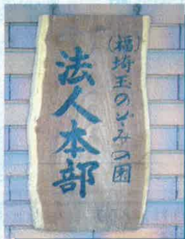
【本部入口脇にある表札】 本部は旧春日園事務センターの建物に置かれている。

半年経過し、会計事務局の業務は落ち着きを取り戻しました。これからは、法人事務局としての課題に取り組んでいきたいと考えております。