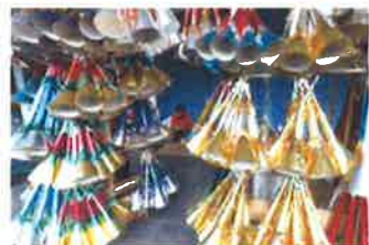
通りで売られるトランペット