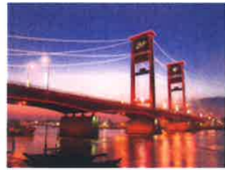
花火を楽しむ「ジェンパタン」