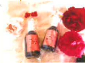
ローズウォーター 1,000円