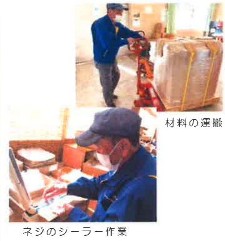
ネジのシーラー作業

「働く」とは『健康づくりだと思っ入れている』。生活の中で仕事を頂けていくことが大事だと教えり(インタビュー…広報委員 鈴木)