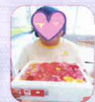
大切に育てています！