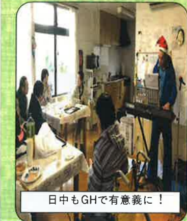
日中もGHで有意義に！